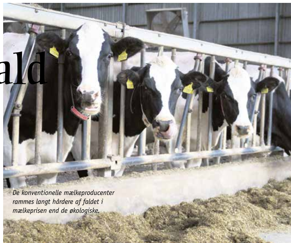
De konventionelle mælkeproducenter rammes langt hårdere af faldet i mælkeprisen end de økologiske.